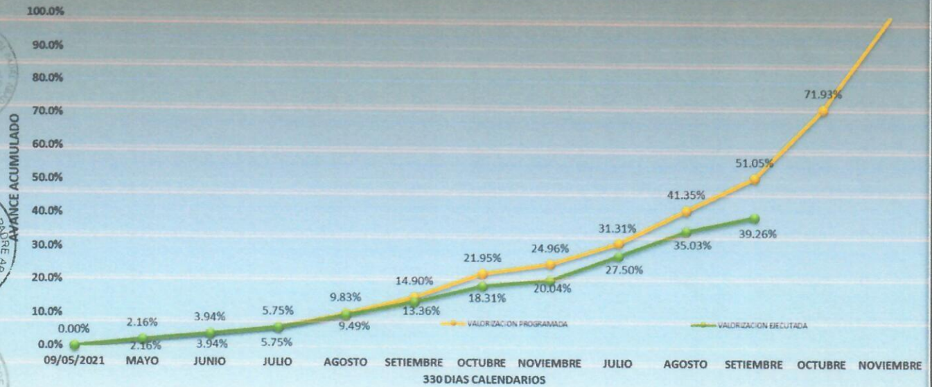
CURVA "S" DE VALORIZACIONES DE OBRA